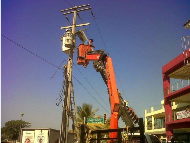
Proyecto “Expendio de Cerveza, Pantanal” Realización de proyecto de Instalación de Fotoceldas Domicilio Pantanal, Nayarit