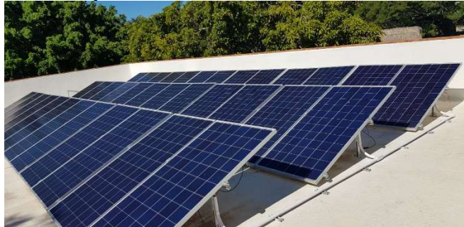
Proyecto “Domicilio Particular Valle Dorado, Nayarit Realización de proyecto de Instalación de Fotoceldas Domicilio Fracc. Valle Dorado, Bahía de Banderas, Nayarit