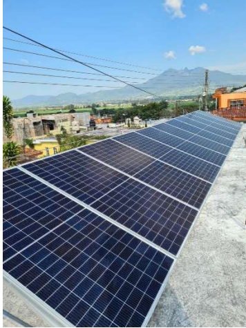
Proyecto “Escuela Higuera Blanca, Nayarit Realización de proyecto de Instalación de Fotoceldas Domicilio Higuera Blanca Nayarit