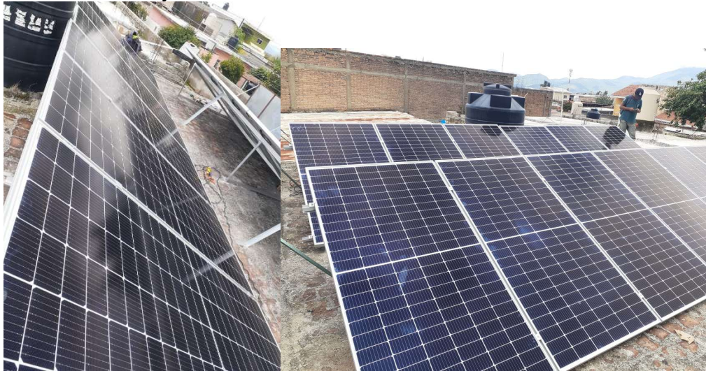
Proyecto “Tienda de Abarrotes, Pantanal” Realización de proyecto de Instalación de Fotoceldas Domicilio Pantanal, Nayarit